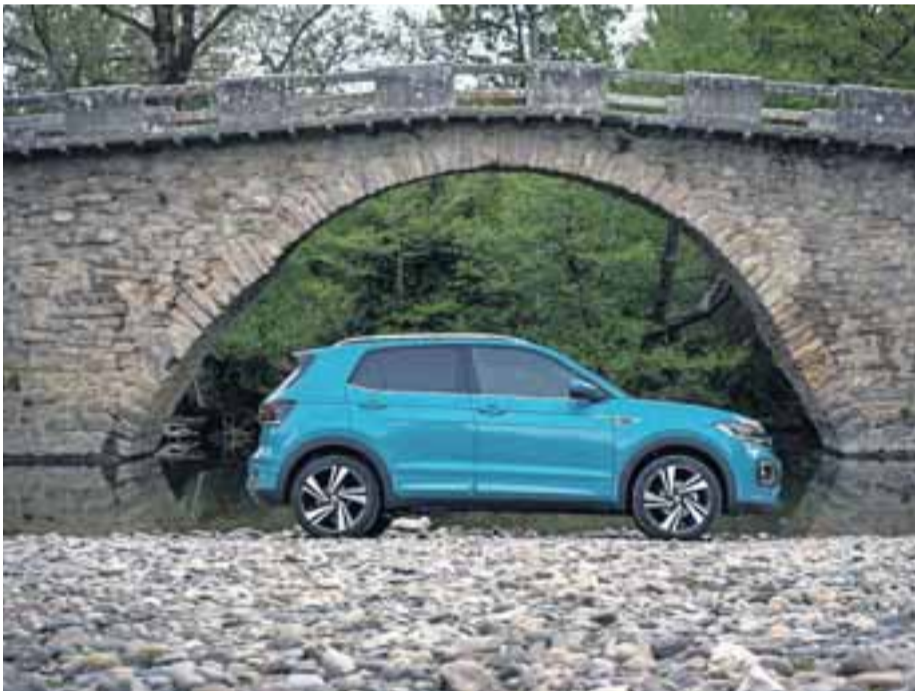
Bajo el puente de Irotz, en Esteribar. Un SUV de 'bolsillo'.