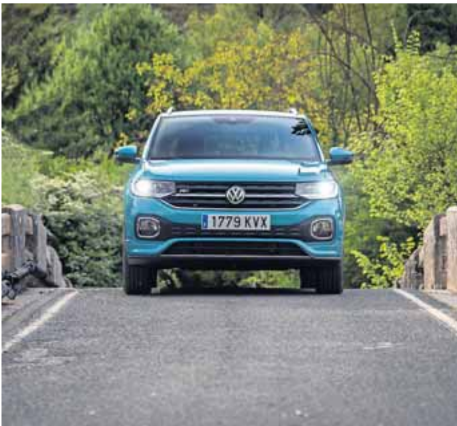
El T-Cross cruza el puente de Irotz. En la parrilla figura el anagrama R-Line.