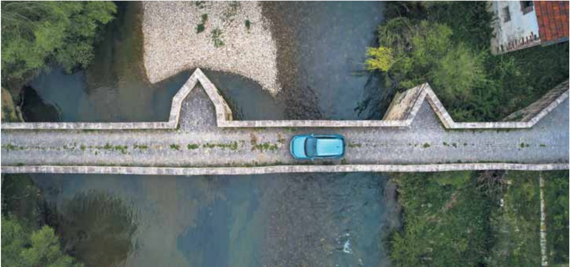
A VISTA DE PÁJARO. El T-Cross rueda sobre el puente medieval de Aribre, que atraviesa el río Irati.