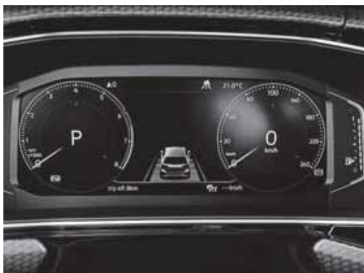
El Digital Cockpit es una de las joyas tecnológicas del T-Cross.

De serie, incorpora el sistema de aviso de salida del carril Lane Assist y el de vigilancia Front Assist, con sistema de detección de peatones y función de frenada de emergencia en ciudad. Un aliado para el conductor. De hecho, de retorno a Pamplona, en la Avenida de Zaragoza, una frenada repentina del vehículo precedente puso a prueba de manera involuntaria este sistema, que 'clavó' los frenos del T-Cross para alivio de los ocupantes.