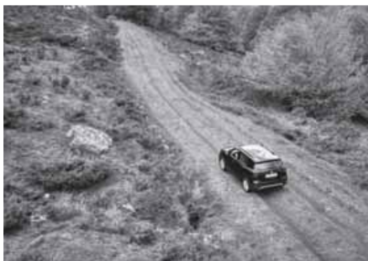
Rueda sin problemas sobre pistas en buen estado. En la imagen, cerca del collado de Azpegi, en el límite con Francia, tras pasar la fábrica de armas de Orbaizeta (Valle de Aezkoa).