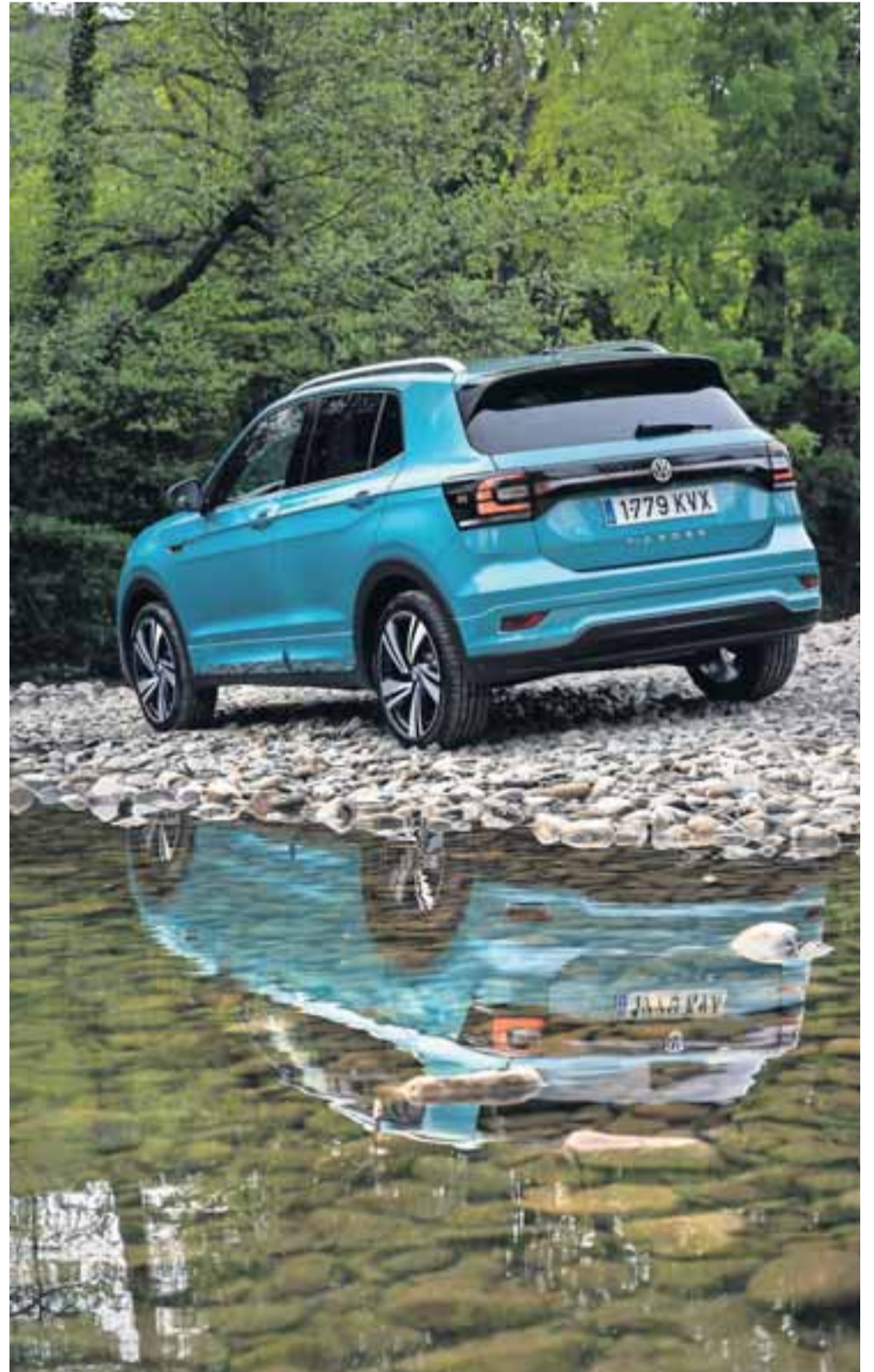
A los pies del río Arga y sobre unas piedras junto al puente de Irotz.